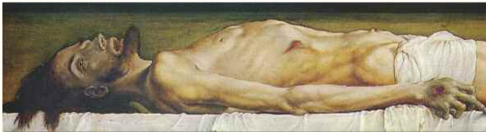
Hans Holbein, Cristo morto nel sepolcro , olio su tavola, (1521, Kunstmuseum, Basilea

e che si è dedicato al realismo al fine di sottolineare la condizione umana. L'opera s'intitola Allegoria della risurrezione , ed è in grisaille . Anche Devonas entra prepotentemente nel sepolcro con il suo ideale obiettivo per guardare a Cristo nel momento supremo della morte, ma il suo sguardo non indaga sulle lividure della morte, bensì sulla misteriosa energia che sprigionò il suo corpo.