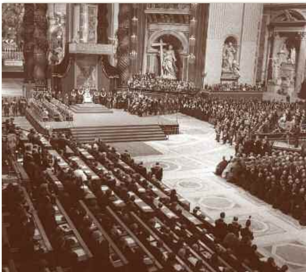
L'immagine di una seduta del Concilio Vaticano II aperto da papa Giovanni XXIII nel 1962

La vita di Angelo Giuseppe Roncalli fu sempre profondamente segnata dalla devozione, non solo alla Madonna nera di Czestochowa, ma anche a quella per un giovane santo polacco san Stanislaw Kostka. Leggiamo nel suo diario spirituale, già nel 1895, una nota a tal proposito: Roncalli aveva appena 14 anni! Allora non dovremmo meravigliarci che questi due grandi Papi, Giovanni XXIII e Giovanni Paolo II che hanno in comune tante cose, siano uniti anche nel giorno della loro canonizzazione e sarebbe bello che anche noi, seguendo l'esempio del Papa buono conoscissimo la Polonia, un grande paese cristiano fin dal 1966 e patria di Giovanni Paolo II e di Suor Faustina Kowalska, messaggera della Divina Misericordia. La più vicina occasione potrebbe essere il pellegrinaggio in Polonia organizzato dall'Ustal di San Marino nei giorni 29 maggio - 3 giugno prossimi.