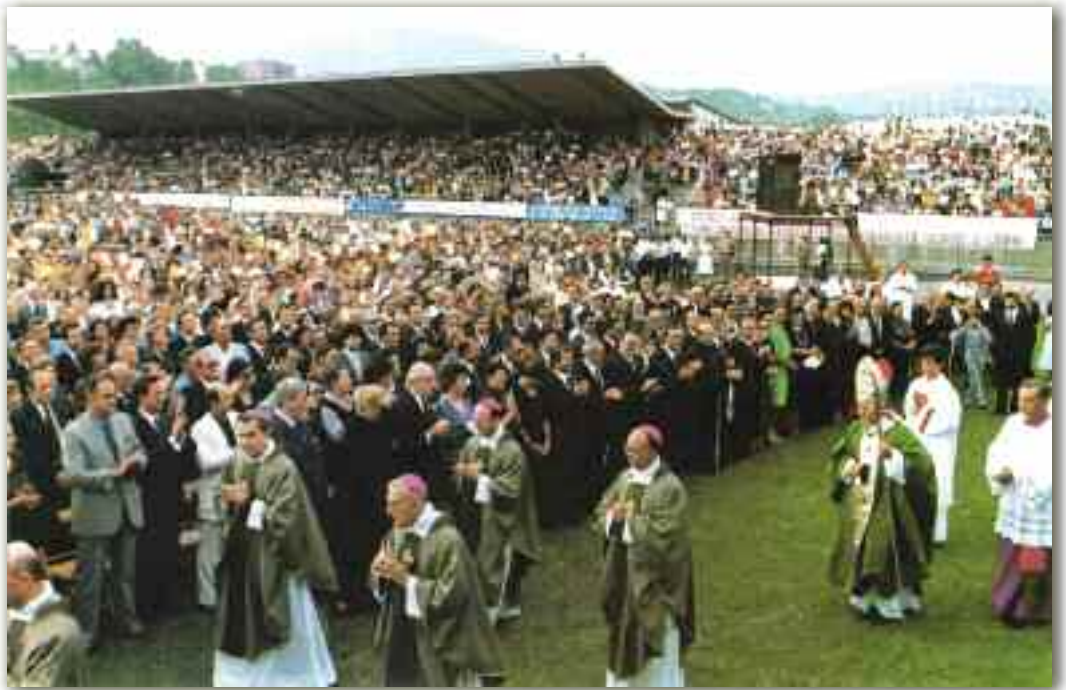
Serravalle (RSM), 29 agosto 1982 - Il Santo Padre Giovanni Paolo II si appresta a celebrare la S. Messa nello stadio gremitissimo di fedeli