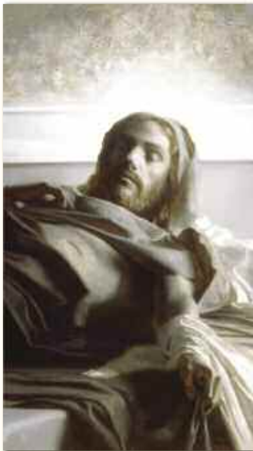
Patrick Devonas, Allegoria della risurrezione di Gesù Cristo

La concretezza del Cristo nel sepolcro di Devonas esprime il realismo della risurrezione e, quindi, la Presenza certa del