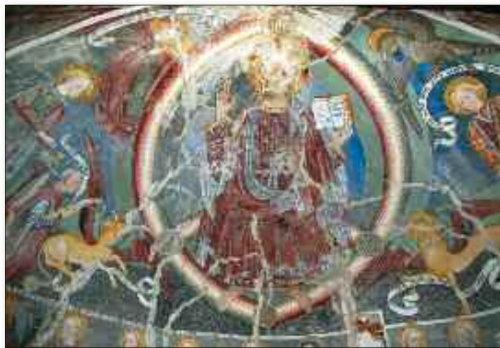
Giovanni e Luca De Campo, Cristo Pantocratore (particolare) , Chiesa dei Santi Nazario e Celso (Sologno, Novara)

Nei primi secoli della storia della Chiesa il credo era il sigillo della propria appartenenza a Cristo. In un tempo in cui i cristiani di origine giudaica frequentavano comunemente la sinagoga, la confessione del Dio trino ed unico e la proclamazione del Kerigma (Cristo, morto per i nostri peccati è risorto per la nostra salvezza), era il modo per riconoscere quanti avevano aderito a Cristo e ricevuto il