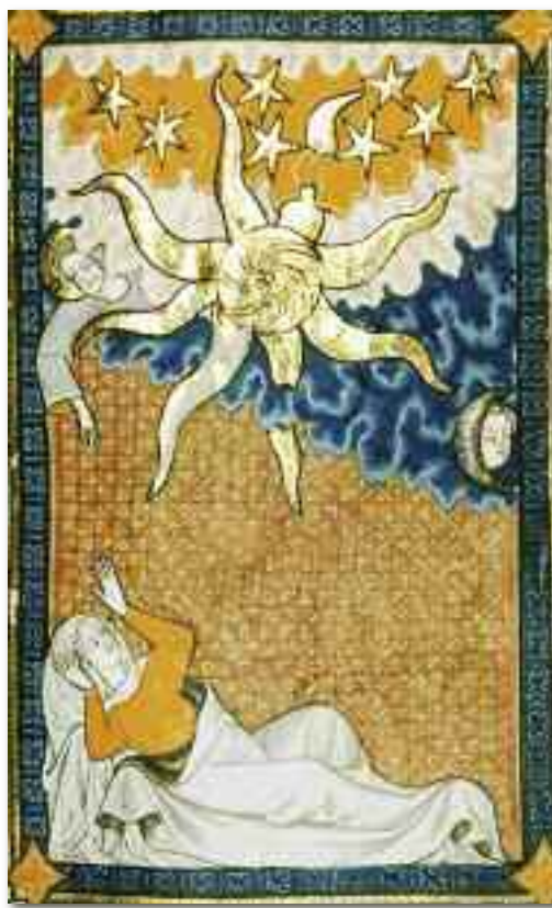
Connubio spirituale miniatura dei Cantici di Rothsilde , XV secolo

nostra enne ). La prima lettera, figurativamente, rimanda alle corna e quindi esprime la potenza, la seconda rimanda all'utero (è anche la lettera del nome Miriam; queste due lettere, infatti, formano anche la parola ebraica mamma מָאָם) la