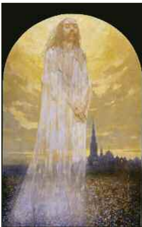
Jerzy Duda Gracz, Ascensione di Cristo, VIII stazione della Via Crucis, Czestochowa

Qui, come si nota non ci sono testimoni, non c'è il popolo di Dio in cui ormai Cristo si identifica, non ci sono nemmeno i discepoli che attoniti guardano verso il Cielo. Qui appare un volto enigmatico che da alcuni viene identificato con il volto stesso del Padre. In realtà, e lo si vede bene per chi conosce la vita e l'o-