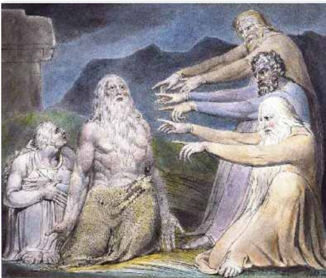
William Blake, Giobbe rimproverato dai suoi amici

Così l'arte lo ritrae nudo e provato, coperto di piaghe, attorniato dagli amici e dalla moglie che, incapaci di aiutarlo ve-