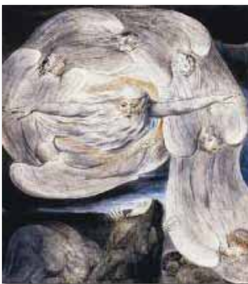
William Blake, Dio portato dagli angeli

Sopportare le persone moleste quindi implica anche la coscienza di un mistero dell'iniquità in atto, che muove a parole o a gesti persone senza che queste ne siano pienamente consapevoli.