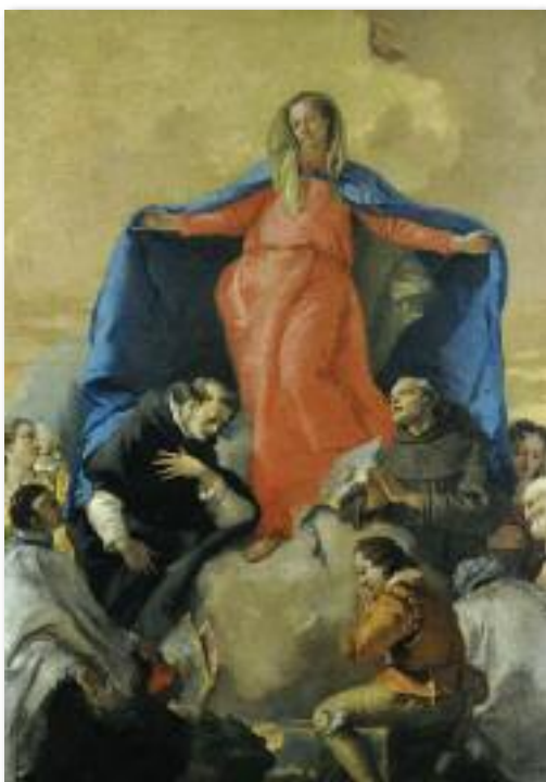
Francesco Zugno (allievo del Tiepolo), La Madonna della Misericordia (1747 ca.), chiesa di San Lorenzo, Montegiardino