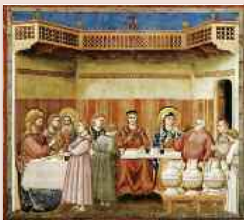
Giotto, Le nozze di Cana , affresco, 1303-1305, Cappella degli Scrovegni, Padova

Vi erano là sei giare di pietra per la purificazione dei Giudei, contenenti ciascuna due o tre barili. E Gesù disse loro: «Riempite d'acqua le giare»; e le riempirono fino all'orlo. Disse loro di nuovo: «Ora attingete e portatene al maestro di tavola». Ed essi gliene portarono. E come ebbe assaggiato l'acqua diventata vino, il maestro di tavola, che non sapeva di dove venisse (ma lo sapevano i servi che avevano attinto l'acqua), chiamò lo sposo e gli disse: «Tutti servono da principio il vino buono e, quando sono un po' brilli, quello meno buono; tu invece hai conservato fino ad ora il vino buono».