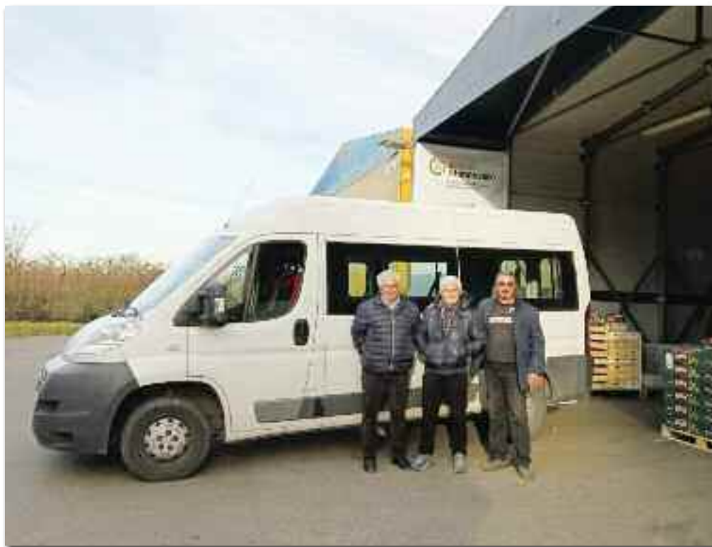
I nostri volontari presso il Banco Alimentare di Imola

Forse non ci accorgiamo del bene necessario e delle difficoltà che ci sono, sto aprendo gli occhi anche io! E grazie alle comunità che nel silenzio sostengono, aiutano, guidano, incoraggiano, costruiscono ponti e abbattono muri, il sacramento del Battesimo si incarna nel vissuto di ciascuno e chi ha necessità è un fratello da accogliere e non un “disgraziato” da cui stare alla larga! Guardiamoci intorno, il tempo che scorre ve-