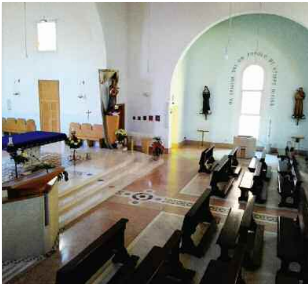
Fonte battesimale nella chiesa parrocchiale di Santa Maria Ausiliatrice (Dogana - RSM)

* Assistente collaboratore Ufficio diocesano per la Liturgia e i Ministri Istituiti