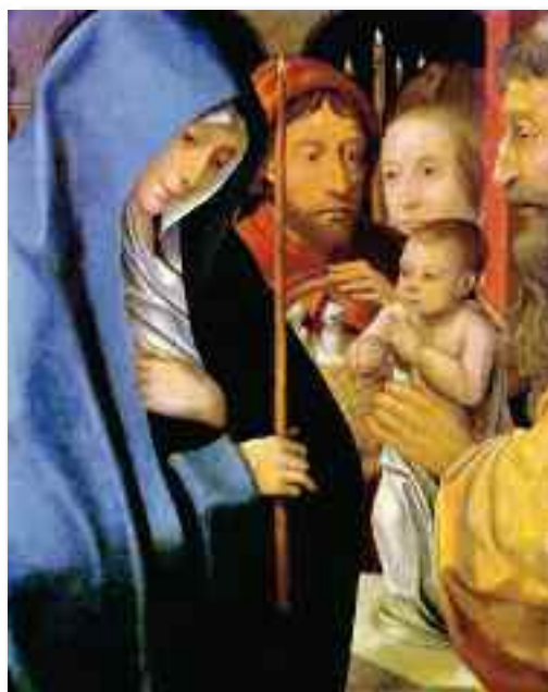
Quentin Metsys or Massys il vecchio, Presentazione nel tempio (ca. 1510-1520), olio su tavola, Collezione Bentinck-Thyssen (Olanda)

Sembra che anticamente si contassero 40 giorni dopo l'Epifania, facendo così